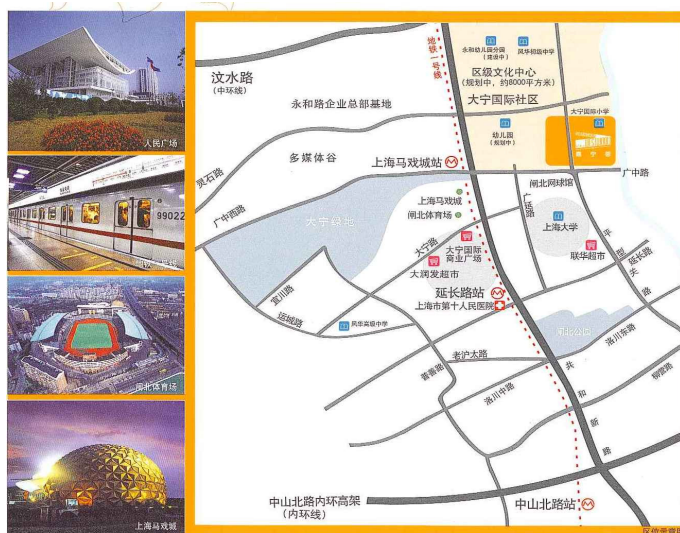
圖一)上海慧芝湖二期-嘉寧薈位置圖: